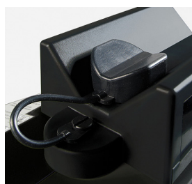
Adapter für unterschiedliche Flaschengrößen

Sie können die Sauerstoffmenge durch Wahl der passenden Flaschengröße ganz einfach an Ihren aktuellen Bedarf anpassen. So liefert z.B. die 1,2 Liter Flasche des Typs ML6 Sauerstoff für durchschnittlich 4 Stunden, wenn sie mit dem Drive DeVilbiss International Sauerstoff-Sparsystem PD1000 ausgestattet ist. Die Füllzeit der Flasche beträgt ca. 90 Minuten. Geht der tägliche Bedarf an Sauerstoff darüber hinaus, bietet sich Flaschengröße C oder D an: Diese gewährleisten eine Sauerstoffversorgung für 6 bzw. 10 Stunden (in gepulstem